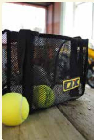
ホイールバック 車いすの背部に装着して使う、ホイールを入れるためのメッシュバッグ。ほこりが溜まらないので清潔。