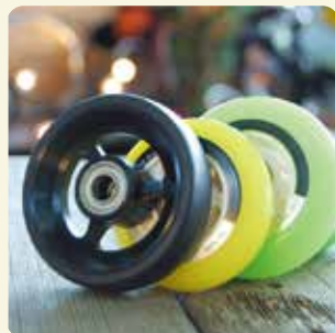
キャストホイール各種 接地面がフラットでオムニコート向きな LPCタイプ(写真左)と、ハードコートで抵抗の少ない樹脂コア(写真中・右)をご用意。