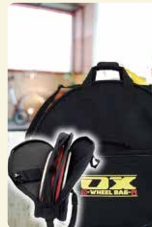
ホイールバック フレームからはずしたホイールを傷や汚れから保護し、安全に運ぶためのバック。3本収納でき、小物入れも完備。