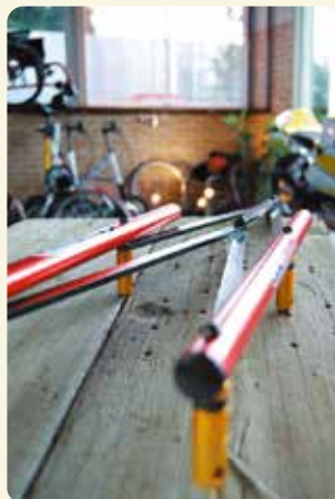
トリアングルゲージ フレームに対する平行や左右ホイールの平行度を測定するための道具。ご自分で調整が出来る上級者向け。