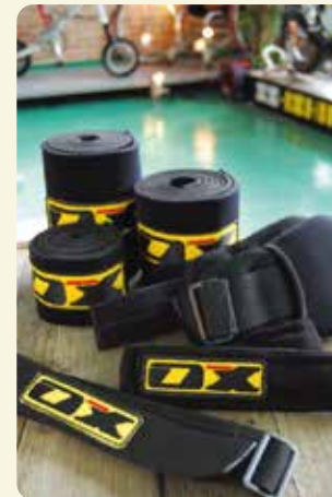
ベルト各種 エラストックベルト(S/M/L) 伸縮する素材のベルト。体を起こす動作を補助させるなどの使い方が出来る。面ファスナー着脱式アシストベルト レザーやパイプ部分に固定可能で汎用性が高い。バックルで楽に着脱ができる。パッド部分のみの交換も可能。 ホールディングベルト(S/M/L) パイル地のソフトなベルト。面ファスナー着脱式で、補助的な用途に向く。 ハードシートベルト 座部に固定して使う硬く厚みのあるベルト。リングで折り返し、面ファスナーで着脱する。